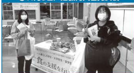
●11月9日/道教育大岩見沢校