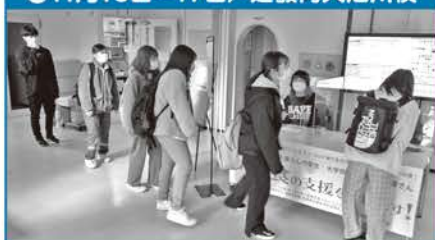
●11月16日~17日/道教育大旭川校