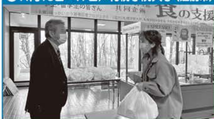
●11月16日~17日/札幌学院大学(江別市)