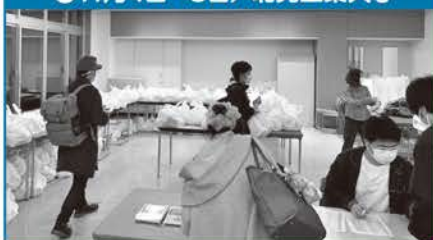
●11月4日~5日/北見工業大学