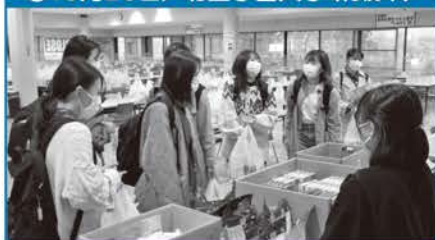
●10月20日/北星学園大学(札幌市)