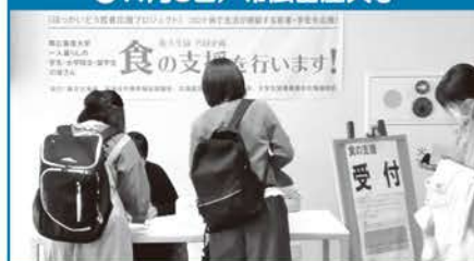
●11月8日/帯広畜産大学