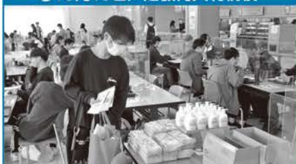
●10月13日/道教育大札幌校