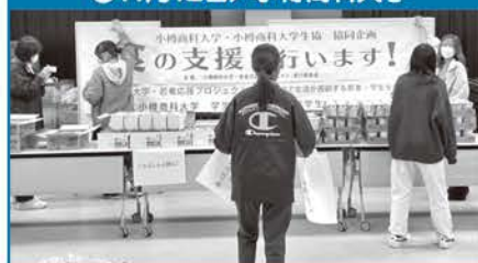
●11月12日/小樽商科大学