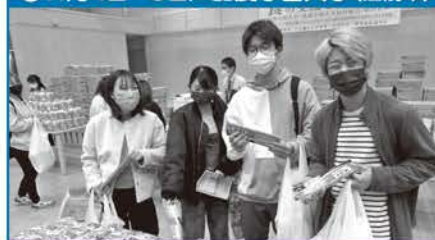
●11月4日~5日/酪農学園大学(江別市)