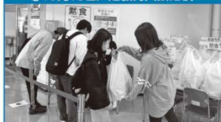
●10月15日/道教育大釧路校