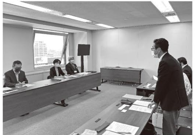
道労働局に対し「雇用における男女平等に関する要請」を実施

その後、このコロナ禍において自治体職場で浮かび上がってきた妊娠中の職員の働きづらさや女性が多い非正規雇用の課題、連合北海道の調査結果から、次世