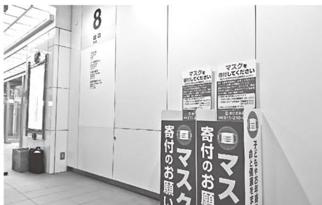
地下鉄大通駅8番出口付近

http://www.rengo-hokkaido.jp/whatsnew14/?p=4806