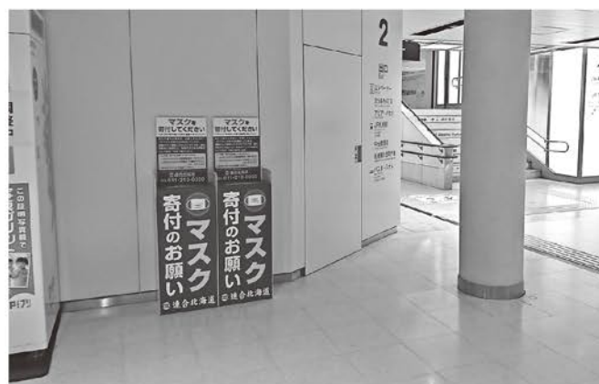
地下鉄さっぽろ駅2番出口付近