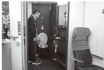
ユニバーサル対応の広いトイレを完備