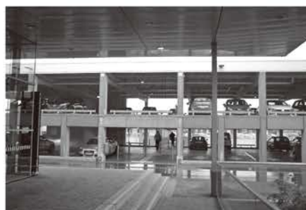
バーデン駅のインターモーダルターミナル 駐車場と列車ホームが同じ高さで直結