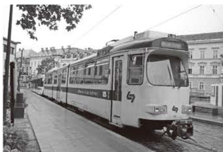
バーデン行きトラムトレイン