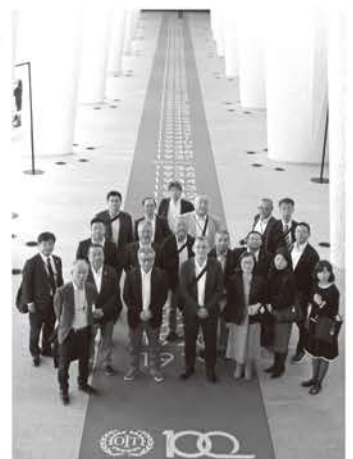
100周年を記念し、創立からの年次が記されたカーペット