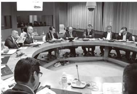
活発な意見交換が行われた