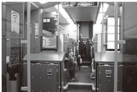
CityJet車内はWi-Fi完備 広いデッキは車いす、自転車が乗せられる