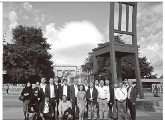
地雷で足を失った人を象徴する国連本部前広場のモニュメント