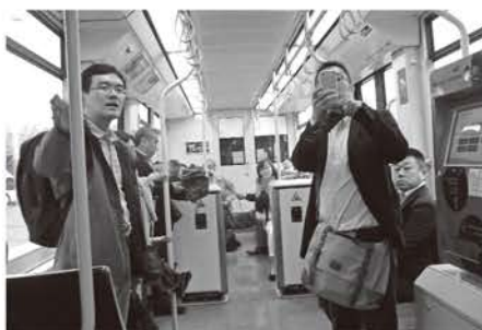
トラムトレイン車内 乗車したら自分で切符に刻印する