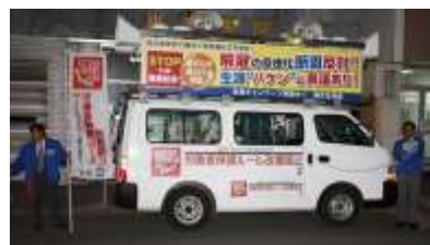
夕闇迫る江差町での街宣行動