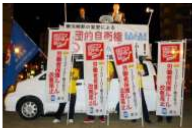
着いたどお! 2800キロの旅 函館到着集会