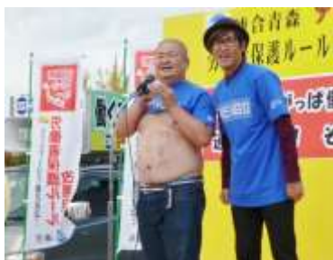
吉本興業キューティブロンズさん 体を張って?!の応援メッセージ