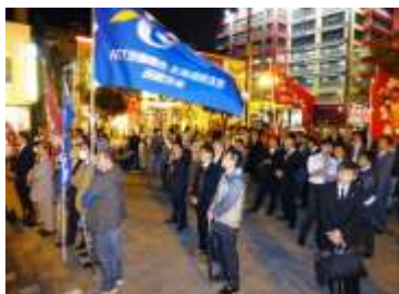
函館大門グリーンプラザ 200人の仲間が集結