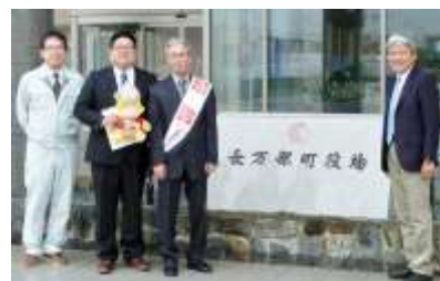
長万部町へ要請行動